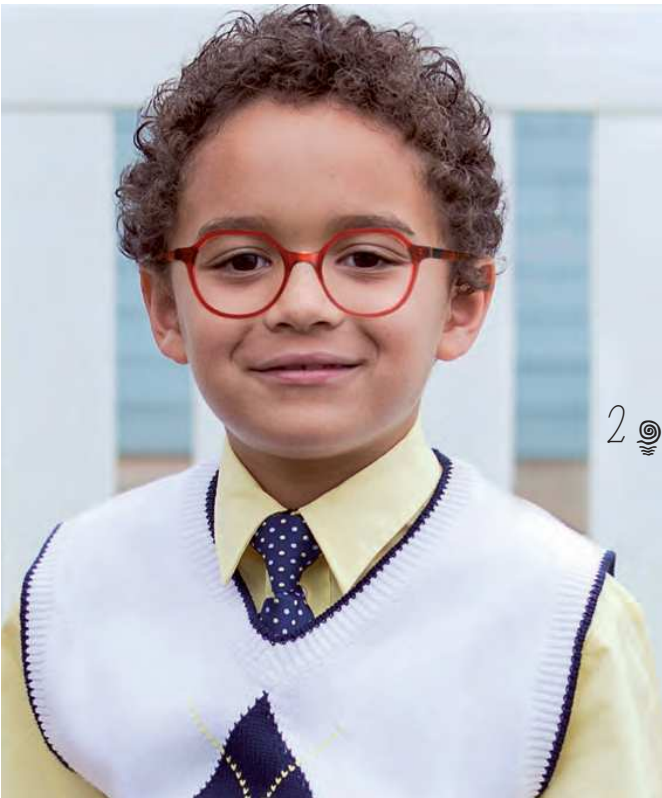
2 Harry's XS

3 : Die Serie Young Mawo Design von You Mawo verbindet Komfort, Robustheit und Leichtigkeit mit optimaler Anpassbarkeit an das jeweilige Gesicht. Hierfür wird bei einem Partneroptiker ein Gesichtsscan erstellt, der im Anschluss für die Fertigung der Brille genutzt wird – für ein unbeschwertes Kinderleben mit richtigem Durchblick. » youmawo.com