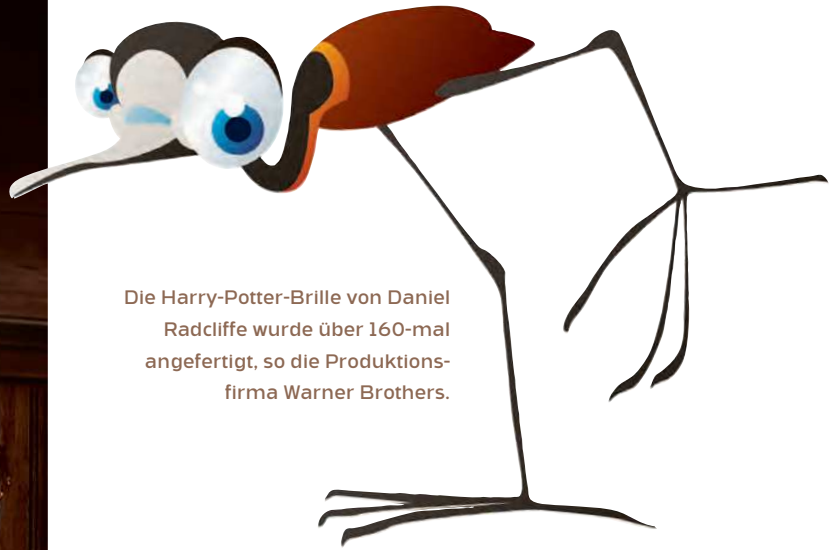
Die Harry-Potter-Brille von Daniel Radcliffe wurde über 160-mal angefertigt, so die Produktionsfirma Warner Brothers.

1 : J.F. Rey Teens richtet sich an Jugendliche ab 12 Jahren. Reife Farben in Ton-in-Ton verschmelzen harmonisch mit Retro-Formen (aus Metall und Acetat) und schaffen so einen nüchternen, modernen und raffinierten Stil. Die Liebe zum Detail verleiht den Fassungen einen Hauch dezenter Raffinesse, z. B. mit subtil gestalteten Endstücken und weichen Acetat-Collagen an den Seiten. » jfrey.fr