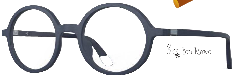
3 You Mawo

Bei den Mayas klebten Mütter ihren Kleinen ein Pechpflaster mit einer Perle ins Haar, die zwischen den Brauen baumelt. Die Kinder schielten dann, was als schön galt.