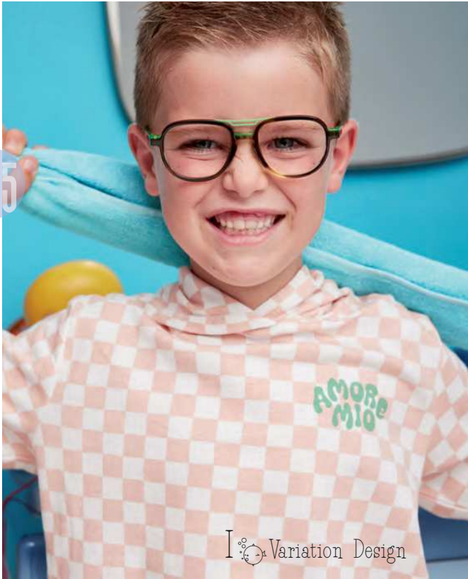
1 Variation Design

1 : Die Kollektion „V.Design Kids“ sieht das Leben in Farbe: In dieser Kollektion gibt es keine Schwerter oder Tiaras, sondern Acetatfassungen in süßen, spritzigen und gemischten Tönen. Diese ebenso farbenfrohen wie stylischen Brillen werden alle schelmischen Augen erfreuen. » variation-design.fr