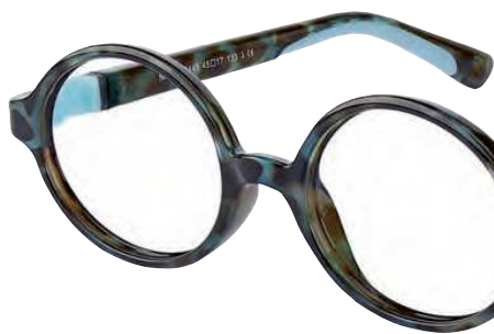
2 Nano Vista